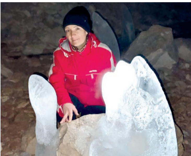
фото на фоне подсвеченных сталагмитов получились отличные.